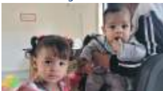
Capacitación - madres cabeza de familia - Bogotá