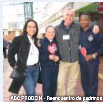
ABC PRODEIN - Reencuentro de padrinos

Gracias a nuestros más de 300 padrinos que hacen realidad este sueño de llevar educación y nutrición para los niños del colegio Didascalio Nuestra Señora de la Esperanza.