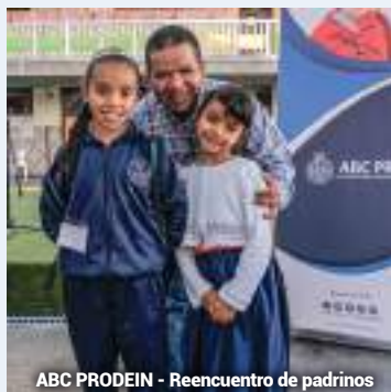
ABC PRODEIN - Reencuentro de padrinos

EN BOGOTÁ CONTAMOS CON 320 NIÑOS APADRINADOS Y 170 NIÑOS QUE AÚN NO CUENTAN CON PADRINO