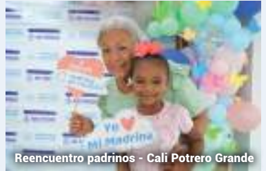
Reencuentro padrinos - Cali Potrero Grande