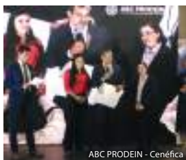
ABC PRODEIN - Cenéfica