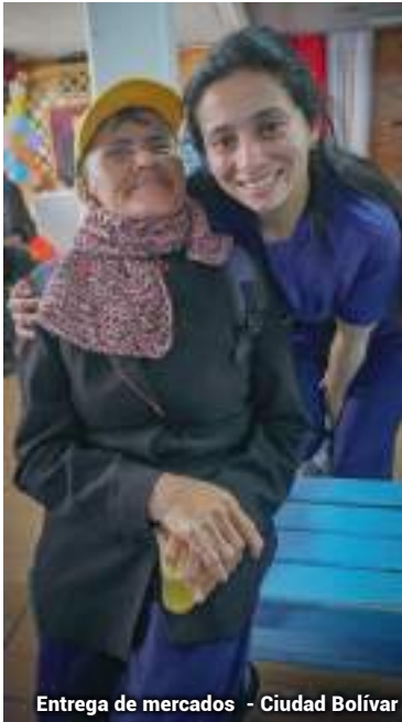
Entrega de mercados - Ciudad Bolívar