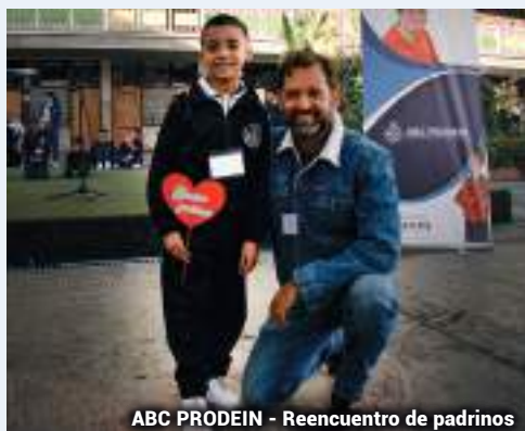
ABC PRODEIN - Reencuentro de padrinos