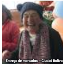
Entrega de mercados - Ciudad Bolívar