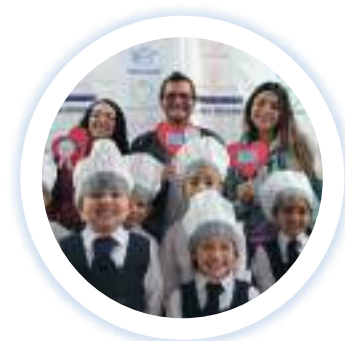
Plan Esperanza julio 2022

Visitamos mensualmente durante todo el año a nuestros niños y la comunidad de Ciudad Bolívar en nuestros planes esperanza.