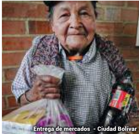
Entrega de mercados - Ciudad Bolívar

"Te hablo mucho de dar de comer al hambriento , pero la principal comida que hemos de dar es la verdad ."