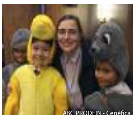
ABC PRODEIN - Cenéfica