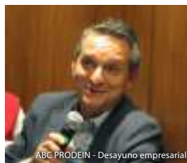
ABC PRODEIN - Desayuno empresarial

PRESENTAMOS NUESTRA OBRA E INVITAMOS A EMPRESARIOS A SER PARTE DE NUESTRO EQUIPO