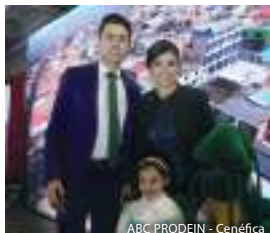
ABC PRODEIN - Cenéfica