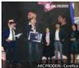
ABC PRODEIN - Cenéfica