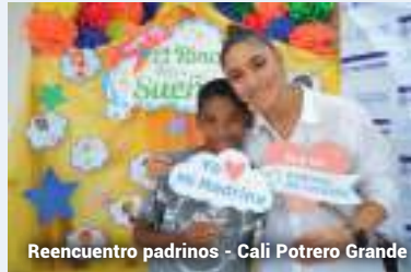
Reencuentro padrinos - Cali Potrero Grande