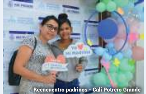
Reencuentro padrinos - Cali Potrero Grande