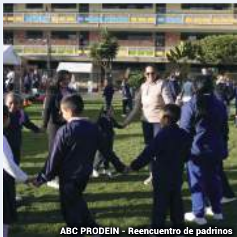
ABC PRODEIN - Reencuentro de padrinos