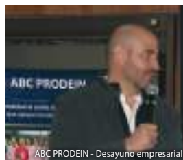
ABC PRODEIN - Desayuno empresarial