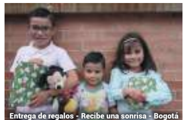
Entrega de regalos - Recibe una sonrisa - Bogotá