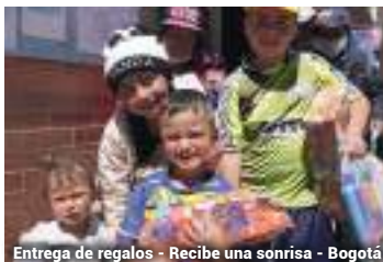
Entrega de regalos - Recibe una sonrisa - Bogotá