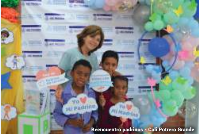
Reencuentro padrinos - Cali Potrero Grande