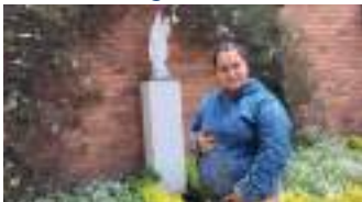
Entrega de mercados - madres cabeza de familia - Bogotá