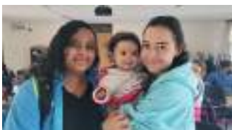
Capacitación - madres cabeza de familia - Bogotá