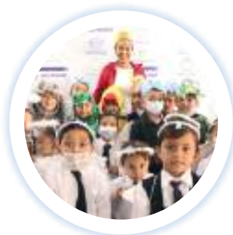
Plan Esperanza marzo 2022