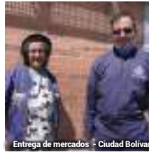
Entrega de mercados - Ciudad Bolívar