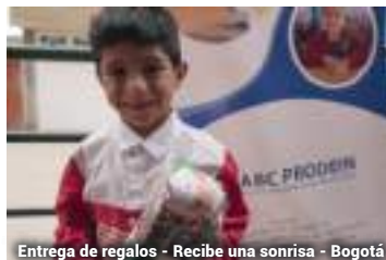
Entrega de regalos - Recibe una sonrisa - Bogotá