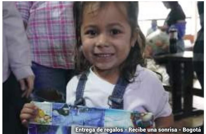
Entrega de regalos - Recibe una sonrisa - Bogotá

ENTREGAMOS MÁS DE 1.000 JUGUETES POR SONRISAS EN BOGOTÁ